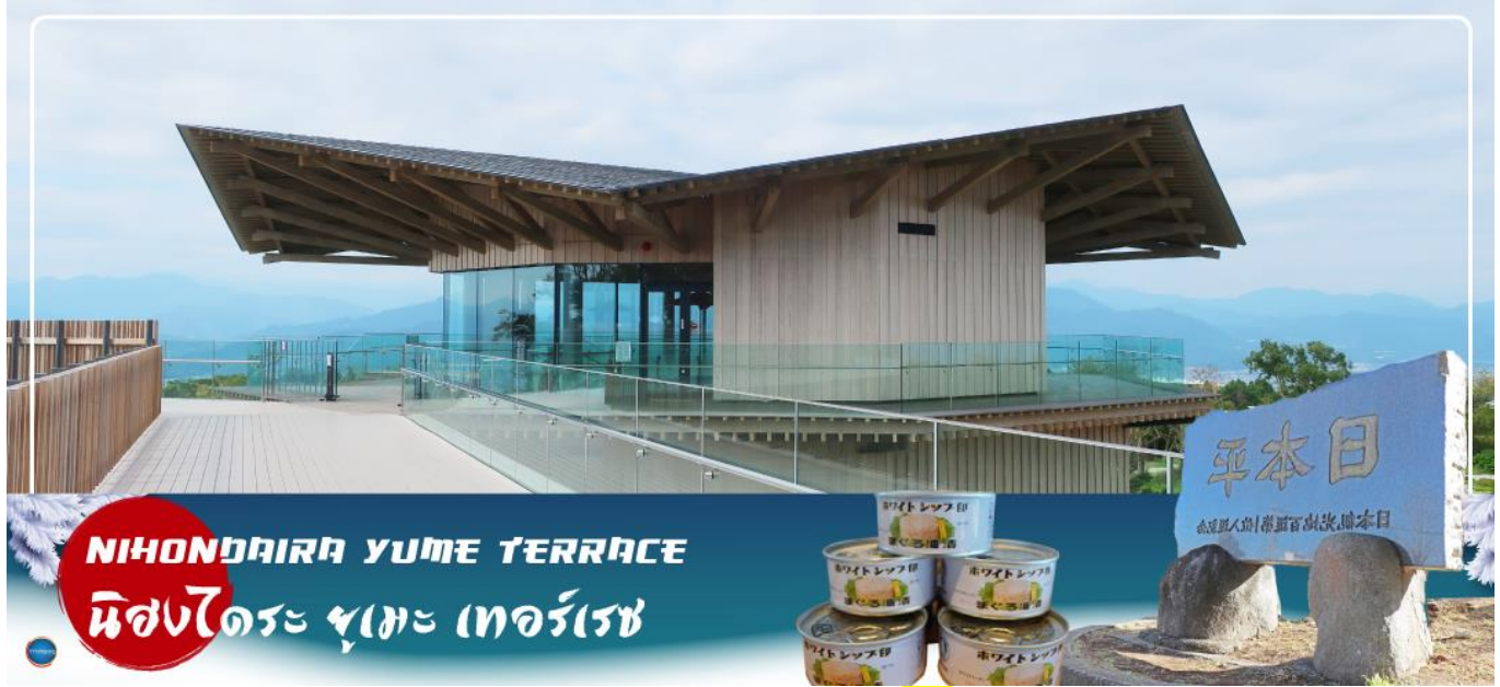
NIHONDAIRA YUME TERRACE นิสงไดระ ยูเมะ เทอร์เรซ

วันที่สี่ เมืองนาโกย่า – จังหวัดชิซุโอกะ – นิสงไดระ ยูเมะ เทอร์เรซ – น้ำตกชิราอิโตะ – เมืองยามานาชิ – หมู่บ้านโอชิโนะสั๊กไก – ออนเซ็น + ชาญี่ปุ่น