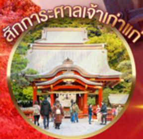
สักการะศาลเจ้าเก่าแก่