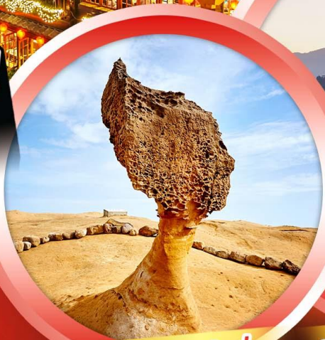
อุทยานแห่งชาติหยี่หลิว