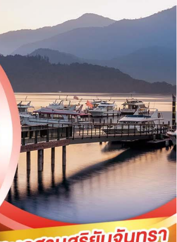
ทะเลสาบสุริยันจันทรา

อิ่มอร่อยกับ..เสี่ยวหลงเปา ซีฟู้ดสไตล์ไต้หวัน