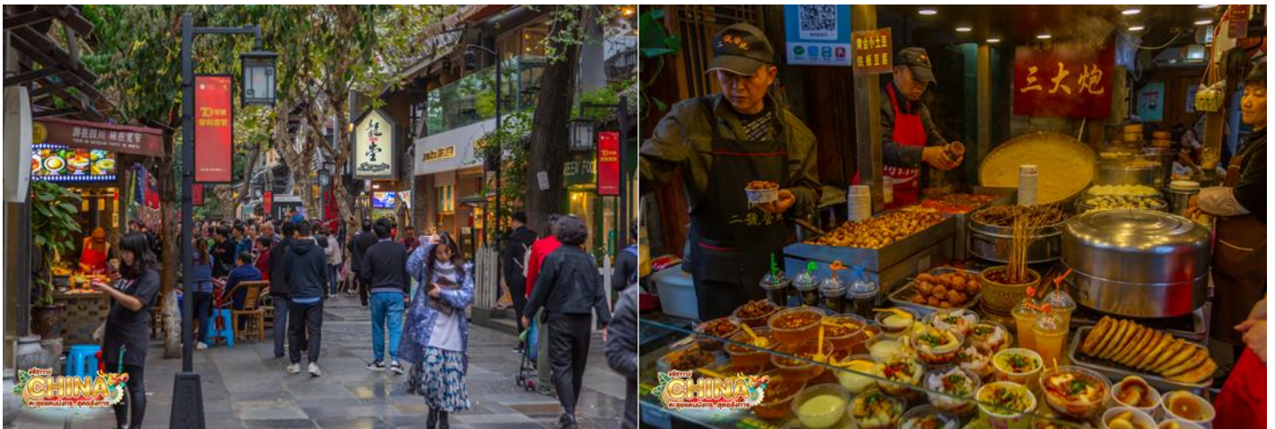
** อิสระอาหารเย็นตามอัธยาศัย เพื่อความสะดวกในการช้อปปิ้ง **

กลางวัน ๑๐ บริการอาหารกลางวัน ณ ภัตตาคาร จากนั้น ชมชั้บบรรยากาศ ถนนโบราณจินหลี่ เป็นถนนคนเดินอยู่ติดกับศาลเจ้าสามก๊ก หรือศาลเจ้าขงเบ้ง (จูกัดเหลียง) มีสินค้าให้ช้อปปิ้งได้ทั้งของรับประทานและของฝากของที่ระลึก หากกำลังมองหาของที่ระลึกที่มีสัญลักษณ์ของเมืองเฉิงตู อาทิ หมี่แพนด้า ตุ๊กตาเปลี่ยนหน้ากาก ชา ผ้าไหม และยาสมุนไพรต่างๆ ก็สามารถมาเก็บครบรวดเดียวได้ที่นี้ และเดินเที่ยว ถนนชอยก้วางชอยแคบ เป็นถนนที่แสดงถึงวิถีชีวิตของคนจีนเฉิงตูในสมัยโบราณ ผสมความเป็นทันสมัยเข้าไปอย่างลงตัว ถนนคนเดินมี 3 ซอย แต่ละซอยมีความยาวประมาณ 400 เมตร มีร้านค้าเล็กๆ ตั้งเรียงรายอยู่ในแต่ละซอยและตรอกให้เดินช้อปปิ้งกันเพลิน ทั้งร้านหนังสือ ร้านชา-กาแฟ บาร์ เสื้อผ้า ไปจนถึงร้านอาหารนานาชาติ