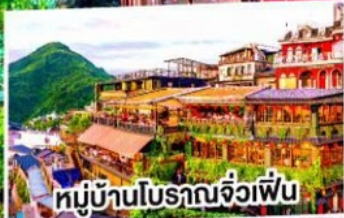
หมู่บ้านโบราณจิวเฟิ่น