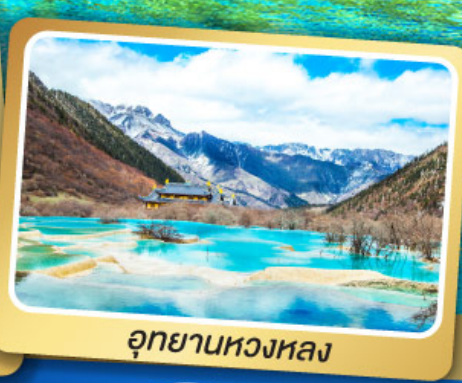
อุทยานหองหลง