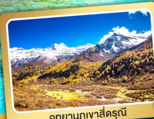
อุทยานภูเขาสิ่ครุณี