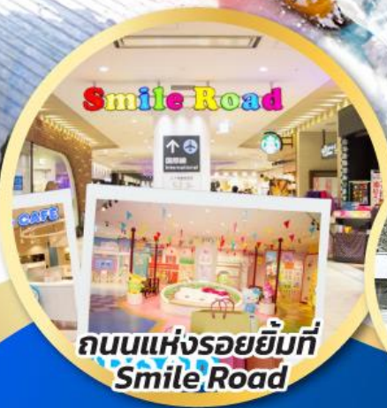
ถนนแห่งรอยยิ้มที่ Smile Road