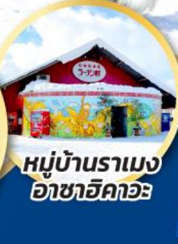
หมู่บ้านราเมง อาซาฮิคาวะ

ชมความน่ารักของน้องๆ ที่สวนสัตว์อาซาฮิคาวะ