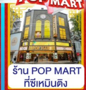
ร้าน POP MART ที่ซีเหมินติง