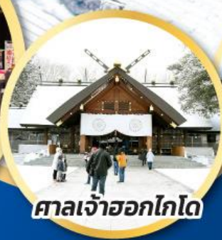
ศาลเจ้าฮอกไกโด