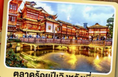
ตลาดร้อยปีเจิ้งหวังเหมียว