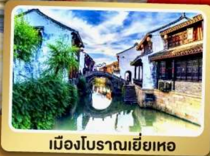
เมืองโบราณเหยี่ยเหอ