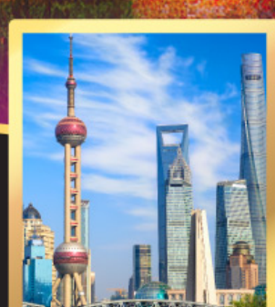
เซี่ยงไฮ้