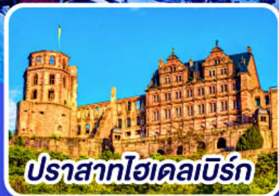
ปราสาทไฮเดลเบิร์ก