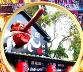
หมู่บ้านปิตาจอ