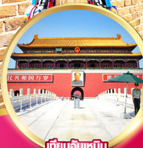
เทียนอันเหมิน