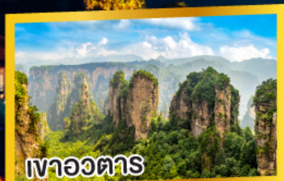
เวาอวตาร

2 เมืองโบราณ ฟูหรงเจิ้น เฟิ่งหวง 6 วัน 5 คืน