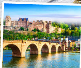
ไฮเดิลเบิร์ก