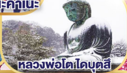
หลวงพ่อดโตโดบตล