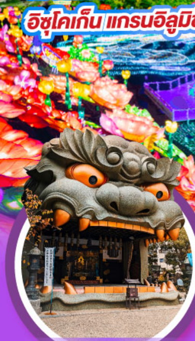
ศาลเจ้านิมบะ ยาชากะ