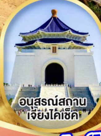
อนุสรณ์สถาน เจียงไคเช็ค