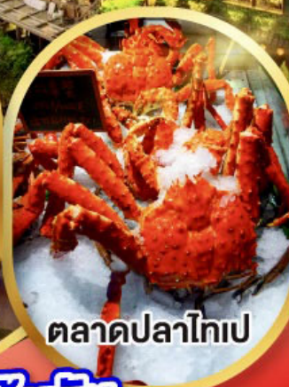
ตลาดปลาไทเป