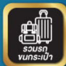
รวมรถ ขนกระเป๋า