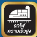
รถไฟ ความเร็วสูง