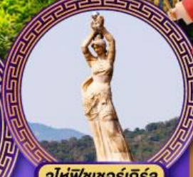
จูไห่พีชชอร์เทิล