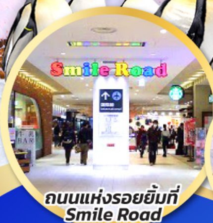
ถนนแห่งรอยยิ้มที่ Smile Road