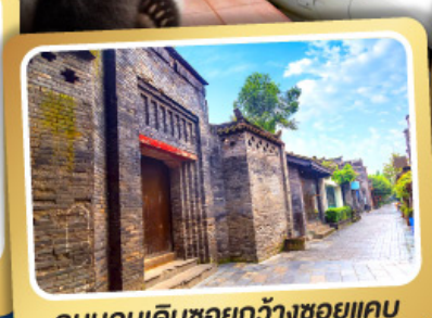
ถนนคนเดินชอยกวางฮวยแคบ