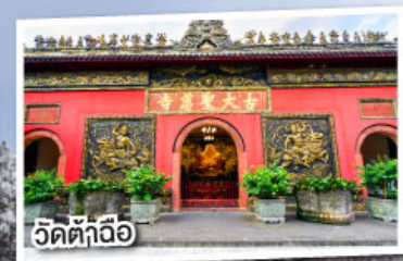
วัดต้าถง