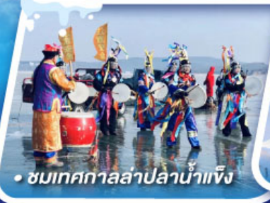
• ชมเทศกาลล่าปลาน้ำแข็ง

เที่ยวหมู่บ้านหิมะ ดินแดนหิมะอันสุดประทับใจ