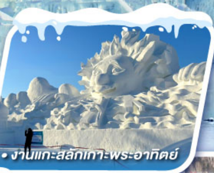
• งานแกะสลักเทวพระอาทิตย์