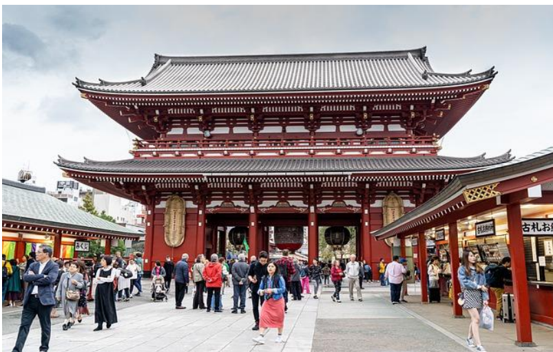
วัดเซ็นโซจิ อาซากุสะ

ท่านสามารถลงไปเที่ยวอิสระตามอัธยาศัย หรือ ซื้อตั๋วเสริมของเรือที่ให้บริการอยู่ได้ ควรซื้อตั๋วเสริมของทางเรือก่อนจะถึงจุดหมายที่ท่านต้องการ 1 วันเดินทาง