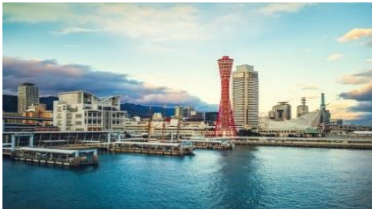
โกเบ ทาวเวอร์ / Kobe Port Tower

ท่านสามารถลงไปเที่ยวอิสระตามอัธยาศัย หรือ ซื้อตั๋วเสริมของเรือที่ให้บริการอยู่ได้ ควรซื้อตั๋ว เสริมของทางเรือก่อนจะถึงจุดหมายที่ท่านต้องการ 1 วันเดินทาง