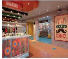
EL LOCO FRESH