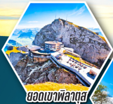
ยอดเขาพิลาตัส