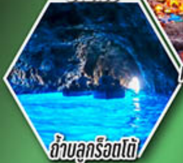
ถ้ำบลูริอตโต้