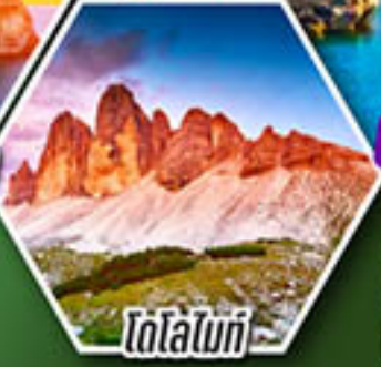
โดโลไมท์

โปรแกรมเดียว เก็บครบจบ อิตาลี ตั้งแต่เหนือถึงใต้