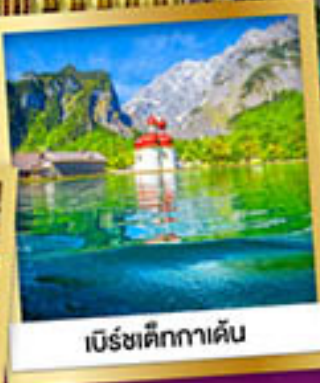
เบียร์ชเติกกาเดิน