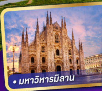
• มหาวิหารมิลาน