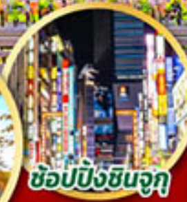
ซ้อปิ้งชินจุกุ