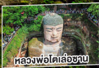
หลองฟอโตเล่อซาน