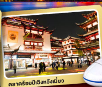
ตลาดร้อยปีเจิ้งหวิงเมี่ยว