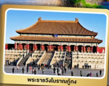
พระราชวังโบราณกู้กง