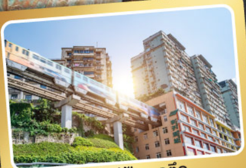
รถไฟฟ้าทะลุตึก