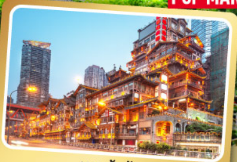
หงหย่าต้ง