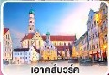
อาคส์บวร์ค