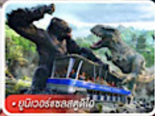
ยูนิเวอร์แซลส์ตูดิโอ