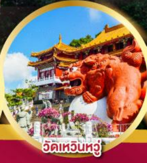
วัดเหวินหฺวู่