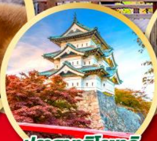
ปราสาทโงโระซากิ