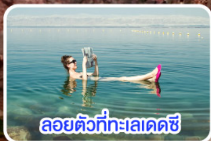
ลอยตัวที่ทะเลเดดซี