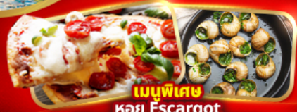
เมนูพิเศษ หอย Escargot Pizza Margherita 1 ภา

อิตาลี มหาวังอาหารดูโอโม่ ชมสิ่งมหัศจรรย์โลก โคลอสเซียม หอเอนปิซ่า สวิส พิธีชงชาของเฟรรา "TOP OF EUROPE" สะพานไม้ชาเปล รูปปั้นสิงโต ฝรั่งเศส เข็มอินปารีส หอไอเฟล ประตูชัย นั่งรถกระเช้าไฟฟ้ามงต์มาตร์ ล่องเรือแม่น้ำแซนชมเมือง ซุปป์ิงแบเรนต์เนมห้างปลอดภาษี เฮกเล็ก