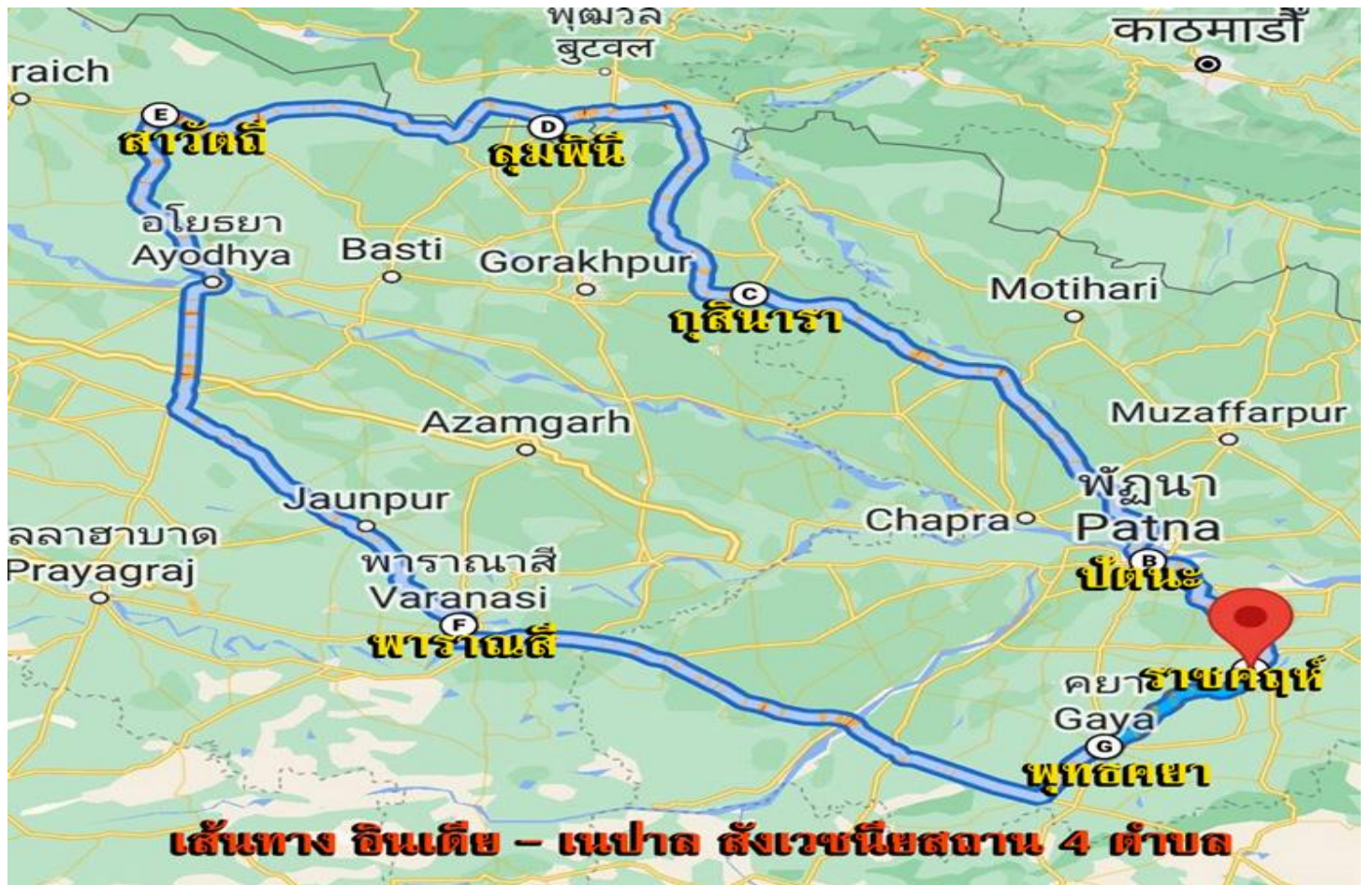
เส้นทาง อินเดีย - เนปาล สิ่งเวชนียสถาน 4 ตำบล