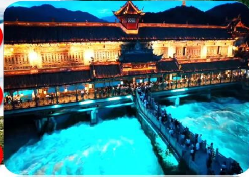
เมืองโบราณตงเจียงเยี่ยน