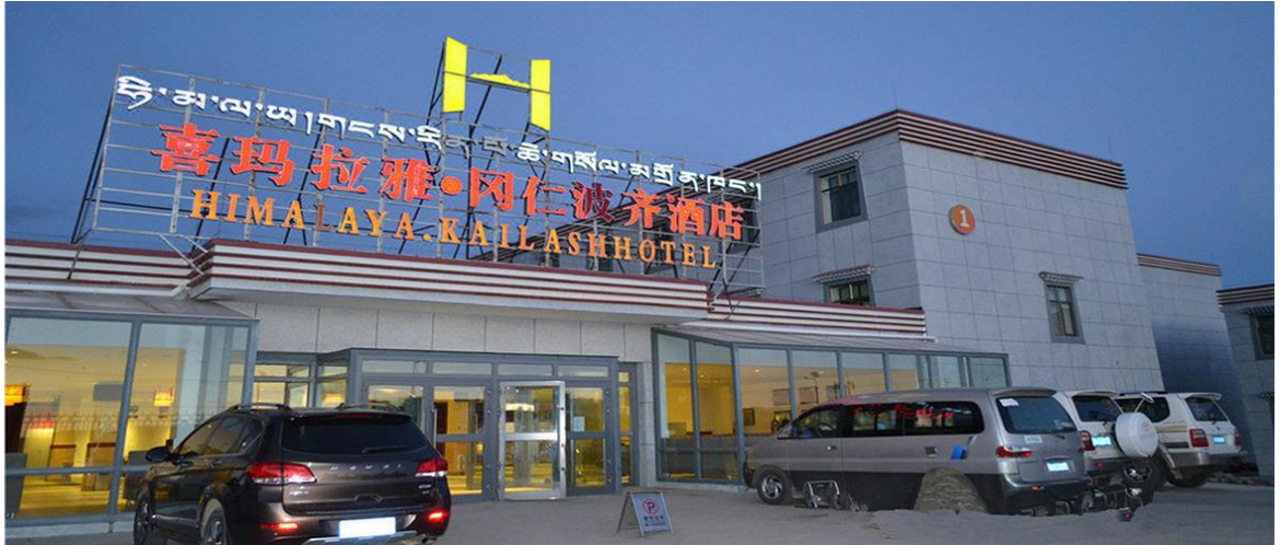
ที่พัก Dharchen Himalaya hotel

วันที่สิบสองของการเดินทาง เมืองดาร์เชน – เมืองซาจำ (เช้า/กลางวัน/-)