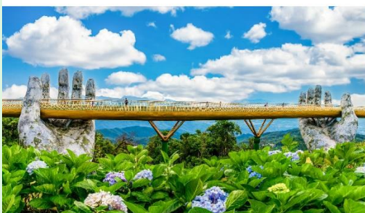
สะพานมือบานาฮิลล์