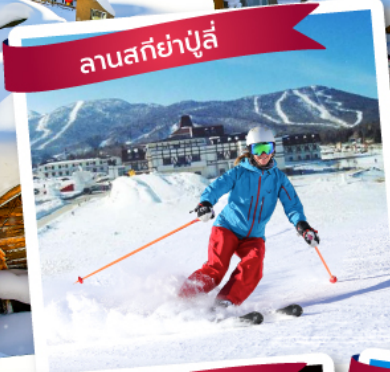
ลานสกียาปูลี่

พักหมู่บ้านหิมะ 1 คืน แถมฟรี ไอติม 1 อัน