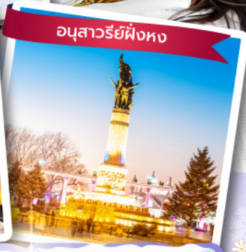
อนุสาวรีย์ผึ้งหง