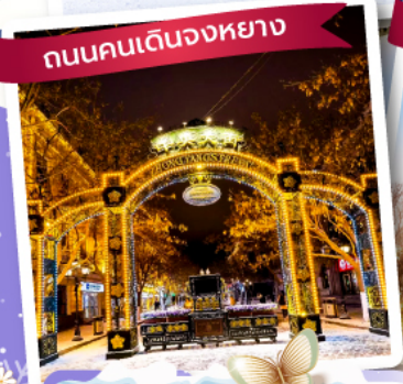
ถนนคนเดินจงหยาง