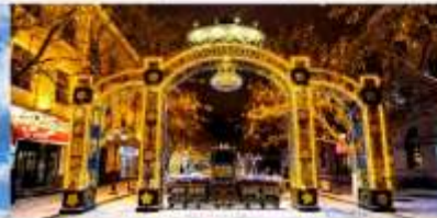
ถนนคนเดินจงหยาง