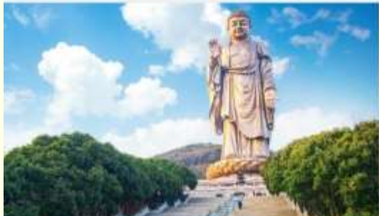
พระใหญ่หลังซานต้าผ้อ