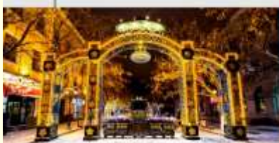
ถนนคนเดินจงหยาง