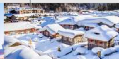
หมู่บ้านหิมะ

*ทางบริษัทฯ ขอสงวนสิทธิ์ในการสลับโปรแกรมทัวร์ตามความเหมาะสมขึ้นอยู่กับสถานการณ์หน้างาน โดยคำนึงถึงผลประโยชน์ของลูกค้าเป็นสำคัญ