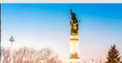
อนุสาวรีย์ผึ้งหง