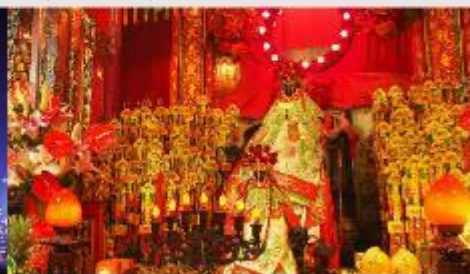
วัดเจ้าแม่กวนอิมของฮ่า

*ทางบริษัทฯ ขอสงวนสิทธิ์ในการลုပ်โปรแกรมทัวร์ตามความเหมาะสมขึ้นอยู่กับสถานการณ์หน้างาน โดยคำนึงถึงผลประโยชน์ของลูกค้าเป็นสำคัญ