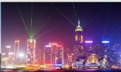
Symphony of Lights