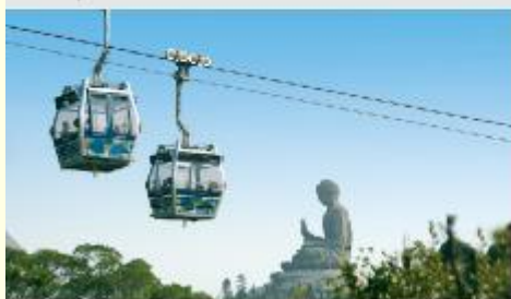
กระเช้าองปิง