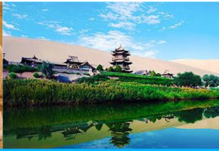
สระน้ำวงพระจันทร์