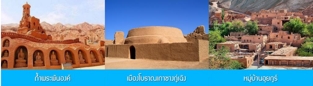
ถ้ำพระพันองค์

ค่ำ รับประทานอาหารค่ำ ณ ภัตตาคาร พักที่ HAMPTON BY HILTON HOTEL โรงแรมระดับ 4 ดาวหรือเทียบเท่าในเมืองถู่หลู่ฟาน