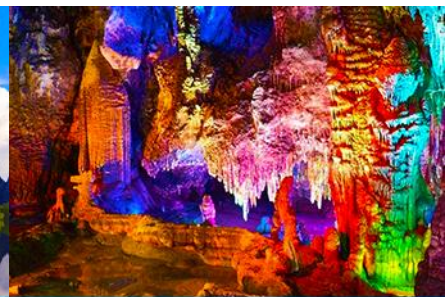
ถ้ำน้ำแข็งหลวง