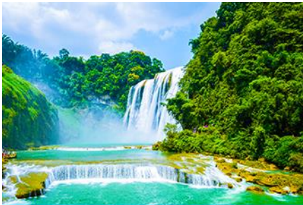
น้ำตกเต๋อเทียน

พักที่ MING SHI HOTEL ระดับ 3 ดาวท้องถิ่นหรือเทียบเท่าในเขตอุทยานหิมิ่งชือ