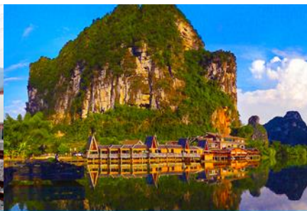
อุทยานหมิงซื่อ