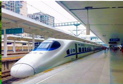
ขบวนรถไฟความเร็วสูงสู่เมืองกุ้ยหลิน