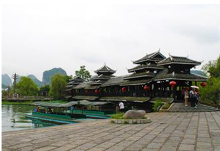
เมืองลิบแล

โรงแรมระดับ 4 ดาวท้องถิ่นหรือเทียบเท่าใน เมืองหยางชวี่